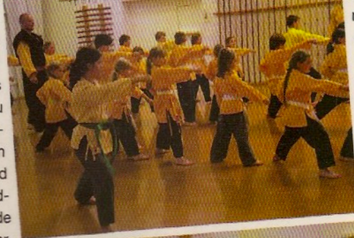
Budopädagogik mit Kempo-Kids