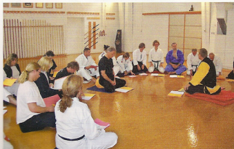
Kampfsportlerfahrung ist Voraussetzung