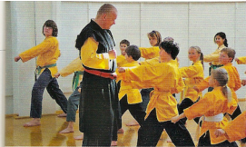
Budopädagoge mit Kindern