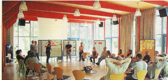
Seminarwochenende in Gauting